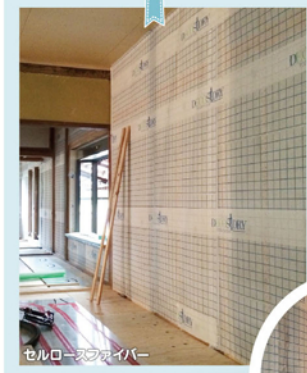
セルロースファイバー